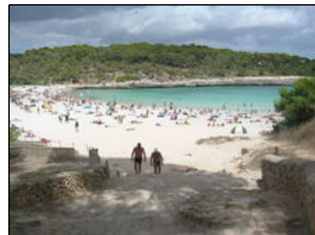
Cala S'Amarador zu Fuß erreichbar

Sie befinden sich nach Expertenaussage am schönsten Strand Europas. Die S'Amarador ist über einen Fußweg mit der Cala Mondragó verbunden. Weitere Buchten sowie der Es Trenc Strand sind in unmittelbarer Nähe. Sie wollen mehr als "nur" Meer...? Dann erkunden Sie die Insel. Santanyí & Felanitx: bekannt um ihre Wochenmärkte; Sóller, Valldemosa und Deía, die Bergen, alles nur einen Katzensprung entfernt. Und... vergessen Sie nicht, in Ihrer Tour die Hauptstadt Palma mit einzuplanen.