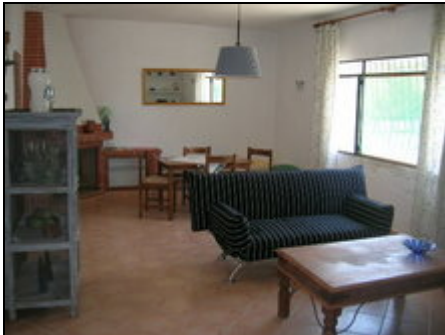
Blick ins Wohn/Eßzimmer

Diese Finca für 4 liegt nur 6 Gehminuten von der Cala S'Amarador entfernt und mitten im Naturschutzgebiet von Mondragó. Herzlich Willkommen im Paradis