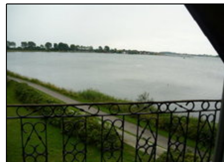
Blick auf Maasholm mit dem Yachthafen

Hochseeangelfahrten/Schleirundfahrten ab Maasholm/Kappeln Ostseebadestrand mit dem Fahrrad in 10 Minuten erreichbar Angeln und Surfen direkt vom Grundstück aus möglich