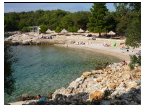
Der nächstgelegene Badestrand

Der Ort Skrpcici liegt in unmittelbarer Nähe zum Fährhafen Valbiska und zum Ort Pinezici. Außerdem sind die malerischen Städtchen KRK und Malinska sehr schnell zu erreichen (beide 9 bis 12km). Das Ferienhaus liegt auf ca. 130m Seehöhe. Das 1100qm große Grundstück ist mit Oliven- und Feigenbäumen bewachsen. Der Strand ist zu Fuß oder mit dem Auto zu erreichen (ca. 2km entfernt). Die Lage des Hauses lädt zum Baden, Wandern und Erkundungstouren ein. Tagesausflüge zu den Plitvicer Seen sind möglich.