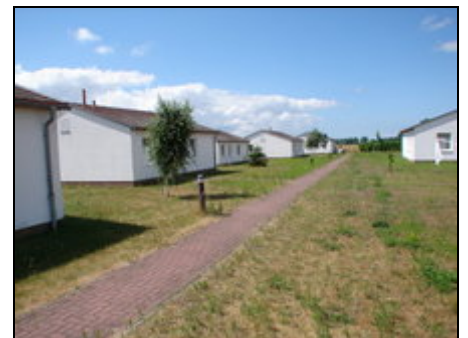
Blick auf die Ferienhäuser

Auf der wohl schönsten Ferieninsel Deutschlands gelegen, bietet Dreschwitz den idealen Ausgangspunkt für Ihre Rad- und Wanderung. Kurze Fahrzeiten zum Ostseestrand / zu den Ostseebädern, zum Störtebeker Festival nach Ralswiek, den Kreidefelsen und vielem mehr machen den Ort, abseits vom großen Gedränge, durch seine ruhige Lage sehr attraktiv. Auf unserem großen Grundstück können die Kinder sich "wunderbar austoben", da die Anlage autofrei ist, lediglich ein Zubringer führt auf das Grundstück.