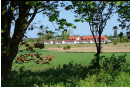
Blick in Richtung Ferienhof

Dreschwitz liegt im Südwesten der Insel Rügen. In ruhiger Lage befinden sich 10 Häuser. Ab sofort nur noch Vermietung an Langzeit- Dauermieter !!!