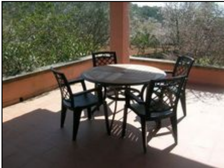
Terrasse mit traumhafter Aussicht

Inmitten einer unberührten Landschaft zwischen Santanyí und S'Algería Blanca im Südosten der Insel befindet sich diese schnuckelige Finca für zwei.