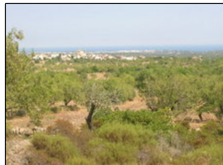
Blick auf S'Algería Blanca

Die Finca liegt direkt am Puig (Berg) Gros auf einem 30.000 m 2 großen Grundstück mitten im Naturschutzgebiet. Bis ins Dorf sind es ca. 3 km; die nächst größere Stadt ist Santanyí ca. 6 km entfernt. Hier gibt es gute Einkaufsmöglichkeiten, schöne Restaurants und mittwochs und samstags den berühmten Wochenmarkt. Porto Petro, der idyllische Fischerhafen, ist nur 10 Autominuten entfernt. Und in Bezug auf die zahlreichen Buchten und Stränden haben Sie hier die Qual der Wahl.