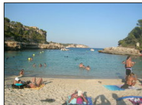
Cala Llombards - Ihre Urlaubsbucht

Es Llombards liegt nur einen Katzensprung entfernt von der Cala Llombards, Cala Mondragó, s'Almonía. Das sind echte Geheimtipps. Nur 15 Autominuten und Sie sind am Es Trenc Strand. Hier können Sie stundenlang am Wasser entlang spazieren (von Colonia St. Jordi bis Sa Rapita), baden, sonnen oder in einer der Restaurants z. B. eine Paella oder frischen Fisch genießen. Santanyi ist bekannt wegen des Marktes am Mittwoch und Samstag. Nach Palma sind es nur 45 Minuten.