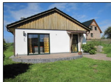
Ferienhaus mit Terrasse

Wittenbeck liegt zwischen dem Ostseebad Kühlungsborn und Heiligendamm. Von hier aus können Sie die Umgebung mit dem Auto oder dem Fahrrad erkunden. Unser Ferienhaus liegt nahe der Kühlung und dem Golfplatz Wittenbeck. Besonders beliebt sind die gut ausgebauten Rad- und Wanderwege, die auch toll mit Inlinern zu befahren sind. Eine Fahrt mit dem "Molli" nach Bad Doberan zum Münster ist ein Muss. Maritime Orte wie Rerik, Warnemünde, lassen sich in 20-45 Autominuten erreichen- Kühlungsborn in 5 min.