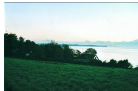
Blick auf Haus Luv (links)

Die Halbinsel Holnis ist eine Landzunge, die die Flensburger Förde in Außen- und Innenförde teilt. An Ihrem Ende befindet sich der nördlichste Punkt des deutschen Festlandes. Diese Halbinsel bietet auf engem Raum all das was die gesamte Gegend ausmacht: vom feinsandigen Kur- bis zum Naturstrand, Steilküste, Wiesen, Wälder und natürlich jede Menge Wasser und frische Luft. Reiterhöfe, Golfplatz, Yachthafen und Surfschule ergänzen das Angebot.