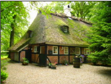
Zufahrt und Eingangsbereich

Das gemütliche Reetdachhaus liegt am Waldrand in unmittelbarer Nähe zur Ostsee.