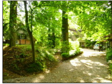
Das Grundstück mit beiden Häusern

Die Region Angeln an der Schlei ist eine der beliebtesten Urlaubsregionen im hohen Norden. Durch die einzigartige Lage zwischen der Schlei, der Ostsee, dem dänischen Grenzgebiet inkl. der Flensburger Förde und der Schleswiger Geest spielt sich hier das Leben direkt an der Küste ab. Zu den bedeutendsten Ortschaften in der Landschaft Angeln zählen neben Schleswig und Flensburg u.a. auch Kappeln, Süderbrarup, Gelting und Arnis.