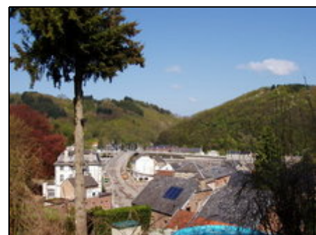
Blick vom Central Park

Das Park liegt im bekanntes "Tal der Maas", nur 200 Meter von der Maas, inmitten einem wunderschönen Naturgebiet mit Wäldern und Felsformationen. Eine ideale Umgebung für lange Spaziergänge. Grotten, Schloss, Burgbesichtigung, Kajak, Bergsteigen, Mountainbike und noch viel mehr. Auf der anderen Seite der Maas gibt es verschiedene Restaurants, Geschäfte, Supermarkte usw. Das idylle Dinant und die Grenze zum Frankreich ist nur auf 11km Entfernung. Kurz: eine Umgebung mit vielen Möglichkeiten!!