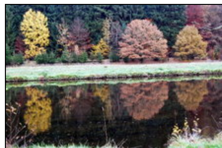
Der Herbst kündigt sich an

Ederbringhausen gehört zur Großgemeinde Vöhl, nahe am Edersee gelegen und grenzt direkt an den Nationalpark Kellerwald-Edersee. Der Ort hat ca. 280 Einwohner; im Ortskern hat man direkte Anbindung an die B 252, nach Frankenberg (12 km) oder Korbach (20 km). Es existiert ein Bäcker mit Café und ein Gasthof. 2 x pro Woche liefert der Metzger aus dem Nachbarort heimische Wurst- und Fleischsorten. Der nächste Lebensmittelladen befindet sich in Schmittlotheim, 3 km entfernt.