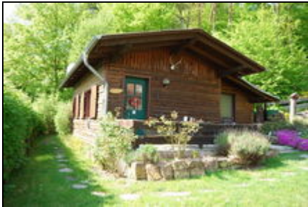
Die Hütte im Sommer