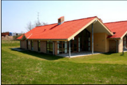
Ferienhaus Nr. 44