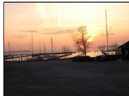
Yachthafen Marina Minde

Die einzigartige, hügelige Landschaft rund um die Flensburger Förde lädt zu ausgedehnten Spaziergängen und Radtouren ein. Von Vemmingbund aus führt entlang der Flensburger Förde der historische Gendarmenweg ins etwa 10 km entfernte Sonderburg. Ausserdem sind es ca. 15-20 km bis nach Apenrade. Die Umgebung ist reich an Sehenswürdigkeiten: Wer sich für Geschichte interessiert, sollte sich beispielsweise die Schanzen und die Mühle von Düppel nicht entgehen lassen.