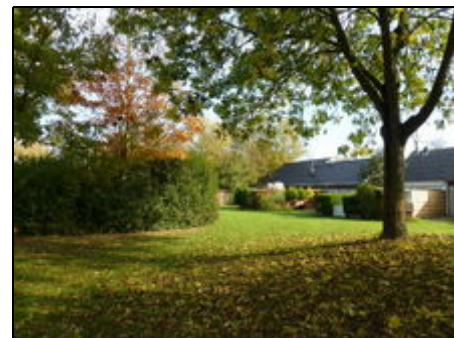
Im Park De Kreek

Durch die unmittelbare Lage am Grevelingermeer haben Sie ideale Wassersportmöglichkeiten. Schwimmen, Tauchen, Segeln, Bootfahren, Wasserski, Wellenreiten, Angeln, etc. Ein Golfplatz liegt in unmittelbarer Nähe. Die Nordsee zum Meerbaden ist nur etwa 15 km entfernt. Fahrradfahren ist selbstverständlich. Ein großer Spielplatz für die Kleinen ist nur 25 m von Haus entfernt. Im Zentrum des Parks ist die Begegnungsmeile mit Supermarkt, Hallenspaßbad, Restaurationen, Fahrradverleih und Waschsalon.