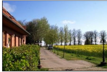
Urlaub zwischen Feld, Wiesen und Meer

Die insgesamt 11 Ferienhäuser "Hof Holm", 700m (5 Fahrradminuten) vom feinsandigen Ostseestrand Kalifornien entfernt, bilden eine kleine, kinderfreundliche Einheit abseits des Autoverkehrs. Der beliebte Urlaubsort Schönberg/ Kalifornien bietet Einkaufs- und Freizeitmöglichkeiten in direkter Nähe. Traumhafter, weitläufiger Sandstrand mit flach abfallendem Wasser. Herrliche Fahrradwege auf dem Deich und in den Salzwiesen laden zu entspannten Radtouren oder Spaziergängen ein.