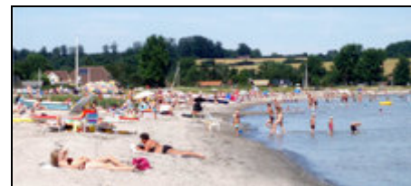
Ein Sommertag in Vemmingbund

Vemmingbund ist eins von Südjütlands bekanntesten und beliebtesten Ferienhausgebieten. Es liegt in naturschöner Umgebung an der Ostküste der Halbinsel Broager, zwischen den Städten Broager und Sonderburg. Viele der Häuser sind nur wenige Meter von dem breiten, kinderfreundlichen Sandstrand entfernt. Genießen Sie die einzigartige Lage inmitten friedvolle Natur und dennoch zentral im Verhältnis zu den Städten und Sehenswürdigkeiten der Region.