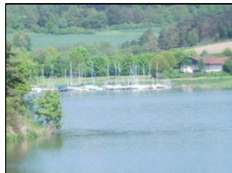
Segelclub am Aartalsee

Unser Ferienhaus liegt direkt am Aartalsee, zu Fuss sind es ca. 300 m zum See. Ahrdt ist ein Ortsteil von Hohenahr. Das Strandbad auf Bischoffener Seite, sowie ein schöner gut ausgebauter Rundweg lädt zum Inline-Skaten, Radfahren und spazierengehen ein. Der Aartalradweg führt vom Aartalsee über Mittenaar bis Herborn. Auch einen Hochzeitsweg haben wir am Aartalsee. In der näheren Umgebung befinden sich Herborn, Wetzlar, Gießen, Marburg und Braunfels mit prachtvollen Fachwerkhäusern.