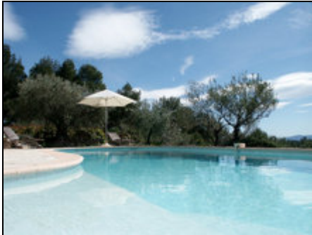
Villa Etoile du Midi

Poolvilla in absolut ruhiger Lage fernab jeden Durchgangsverkehrs. Trotzdem nur einen Spaziergang vom malerischen Städtchen Flayosc entfernt.