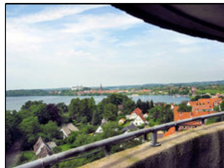
Blick auf Stadt und Schloß Plön

Der Luftkurort Plön mit seinen elf Seen, dem imposanten Schloß und der idyllischen Altstadt bietet die ideale Kulisse für einen gelungenen Urlaub. Wasser- und Naturfreunde fühlen sich hier besonders wohl, haben es aber auch nicht weit zu den Sandstränden der Ostsee (ca. 30 km) und den attraktiven Städten Kiel(ca. 25km), Lübeck (ca. 45 km) oder auch zur Weltstadt Hamburg (ca. 80 km). Weitere Ausflüge und Sportmöglichkeiten - auf Land und Wasser - bieten vielseitige Urlaubserlebnisse.