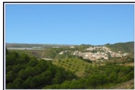
Odeleite am Rande des Stausees

Casa Odeleite liegt leicht erhöht über der Stadt und bietet von allen Fenstern einen wunderschönen Ausblick über das romantische Dorf mit seinen alteingesessenen Bewohnern und über die grüne Umgebung mit Fluss, Wiesen und Bergen. Im Tal fließt ein kleiner Fluss, der den nahen Stausee mit dem großen Grenzfluß zu Spanien verbindet. Sowohl im See als auch im Guadiana lässt es sich im Sommer plantschen, aber auch der lange Atlantikstrand bei Vila Real d.S.A. ist in nicht einmal 30 Min. zu erreichen.