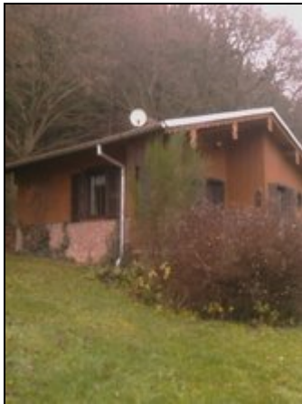
Außenansicht im Spätherbst