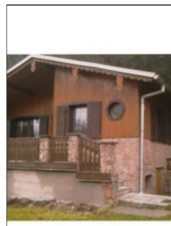
Außenansicht im Spätherbst 2008

In der Ortschaft Dankerode ist ein kleiner Konsum und ein Bäcker für Ihre Einkäufe, außerdem befinden sich drei Gaststätten, ein Kinderspielplatz, ein Tennis- und Fußballplatz in der Gemeinde. Beliebte Reiseziele in der Umgebung sind: Harzgerode mit Harzbahn (Dampflok), Brocken mit Brockenbahn, Hexentanzplatz in Thale, Rosarium Sangerhausen, Schloß in Stolberg (Fachwerk), Kulturerbestadt Quedlinburg und Wernigerode.