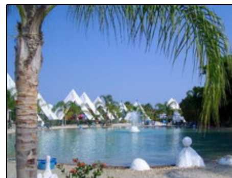
Thermal-See mit Sandstrand