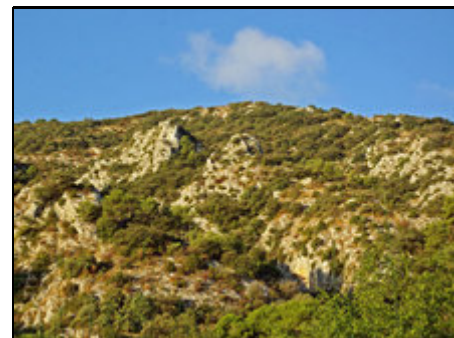
Luberon direkt am Haus

Umgeben von Rebefeldern, am Fuße des Luberon-Nationalpark-Gebirges, genießen Sie eine phantastische Aussicht und finden zahlreiche Spazierwege, aber auch anspruchsvolle Wanderrouten.