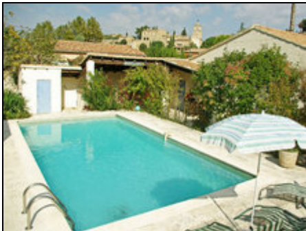
Pool & Haus

Le tournesol - Charaktervolles Ferienhaus mit Pool - der Luberon zum familienfreundlichen Preis