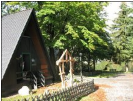
Eingangsbereich Haus "Waldseeblick"

Ferienhaus ( 600m ü.NN ) - 20 Meter zum Bergsee -