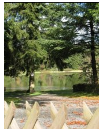
Blick über den Gartenzaun

Rund um Ihr Ferienhaus wollen ca. 60 Seen und Badeteiche (Weltkulturerbe) entdeckt werden.