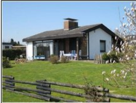
Bungalow in Bliesdorf

Nichtraucher Bungalow direkt am kurtaxfreien Strand, mit schönem Gartenanteil und Terrasse. Für 4 Personen ausgestattet mit Internetzugang und Garage.