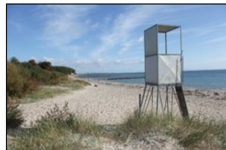
den Strand in Südlage vor der Tür

In unmittelbarer Nähe von Bliesdorf befinden sich die Ausflugsziele, Neustadt und Grömitz. Beide Städtchen sind ein Besuch wert mit ihren kleinen Geschäften, Kunsthandwerk, der kleinen Altstadt, einem Fischerei- und Jachthafen. Weitere interessante Ziele sind schnell erreicht. Die Landeshauptstadt Kiel oder Lübeck und Eutin mit ihren typischen Häusern und romantischen Straßen. Nur etwa 80 km entfernt liegt Hamburg mit seinen Sehenswürdigkeiten und dem weltberühmten Hafen: dem Tor zur Welt.