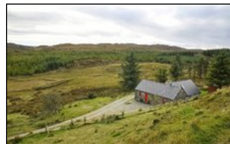
Cottage mit Umgebung

Die alte Anglerloge befindet sich in einer ruhigen, ländlichen Gegend im Herzen von Connemara nur 3 Kilometer von Clifden entfernt. In Clifden, der kleinen, aber entzückenden Kreisstadt Connemaras, gibt es 2 Supermärkte, allerlei Shops, Pubs und Restaurants sowie ein Touristen-Informationsbüro. Vom Cottage aus kann man direkt Wanderungen durch die bezaubernde Landschaft antreten, oder einen Ausflug an einen der zahlreichen weißen Sandstrände in der Umgebung machen.