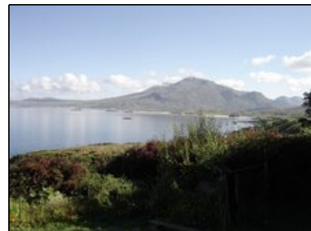
Schoenes wildes Nord-Connemara.

Heatherhill Cottage, am Rande von Letterfrack, einem kleinen, von Meer umgebenen Dorf in einer rauen Berglandschaft, liegt in der wohl unbestritten schönsten Gegend von Connemara. Sie genießen einen einmaligen Blick auf den Diamond Mountain und den Connemara Nationalpark. Im Dorf finden Sie drei Pubs, drei Restaurants, einen Supermarkt, einen Metzger, eine Postannahmestelle, einen Craftshop am Pier und eine Schule, in der Sie im kleinen Kreis Englisch lernen können.