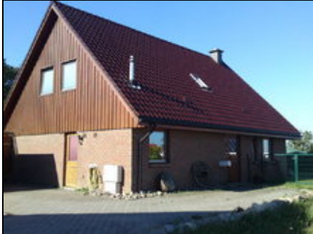
Ferienhaus Haffblick Straßenansicht

Unser schönes Ferienhaus befindet sich in dem Ort Rakow bei Rerik/Kühlungsborn auf einem 1500 qm Grundstück umgeben von Wiesen, Park und Feldern.