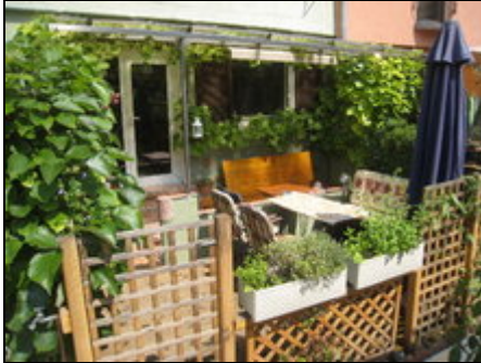
Die Terrasse der Casa Vieja