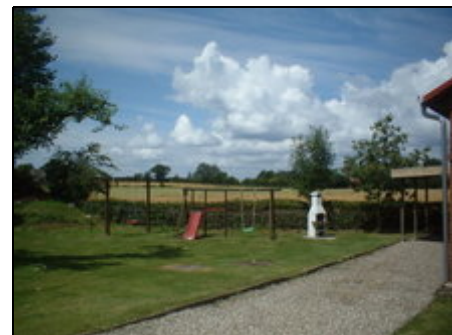
Garten mit Grillkamin

Pommerby liegt in der Landschaft Angeln unweit der Geltinger Birk. Zum Naturstrand von Falshöft sind es ca. 2km, wo auch der Leuchtturm besichtigt werden kann. Der Badestrand mit feinem Sandstrand und der Möglichkeit einen Strandkorb zu mieten ist ca. 4km entfernt. Im Ort befindet sich ein Restaurant mit schwäbischen Spezialitäten. Einkaufsmöglichkeiten und Supermarkt sind im 3km entfernten Gelting. Der Landarzt ist im 12km entfernten Kappeln zu finden. Nach Dänemark sind es ca. 39km.