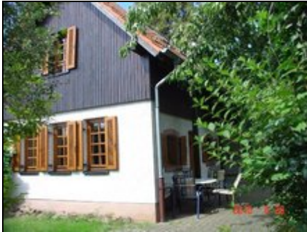
Ansicht Zugang Ferienhaus

In zentraler Lage und doch ruhig und abgeschieden liegt das Häuschen welches von 900 qm Wiesen-und Gartengelände umgeben ist... Siehe Bildergalerie!