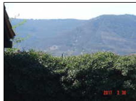
Blick auf Villa Ludwigshöhe + Rietburg

Das Häuschen liegt zentral und trotzdem ruhig und abgeschieden in einem 900 qm großen Wiesen- und Gartengrundstück, das ausschließlich Ihnen als Feriengast zur Verfügung steht. Man ist sein 'eigener Herr' auf dem Feriengrundstück am Fuße des Haardtgebirges inmitten von Reben. Edenkoben liegt an der Deutschen Weinstrasse im Zentrum der Metropolen Ludwigshafen/Mannheim, Kaiserslautern und Karlsruhe. Genauer, in der Mitte zwischen Neustadt/Weinstrasse und Landau/Pfalz, am Ostrand des Haardtgebirges.