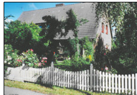
Ferienhaus Schwackendorf bei Kappeln

Der Stadtkern von Kappeln liegt 5 Autominuten entfernt. Dort sind alle Einkaufsmöglichkeiten gegeben. Zahlreiche Restaurants laden ein. Den Ostseestrand und das Ufer der Schlei erreicht man ebenfalls in 5 Autominuten.