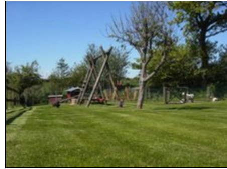
Blick auf das südl. Grundstücksgelände

Quern liegt nur 8 km von der Ostsee entfernt zwischen den Städten Flensburg und Kappeln. Auch die Nordsee erreicht man in einer Stunde.