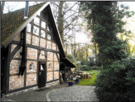
Eingangsbereich mit PKW-Stellplatz

Fachwerkhäuschen für 3 Personen auf ruhigem Parkgrundstück im exklusiven Ortsteil Bremen-Oberneuland. Gute Ausflugsmöglichkeiten/Verkehrsverbindungen.