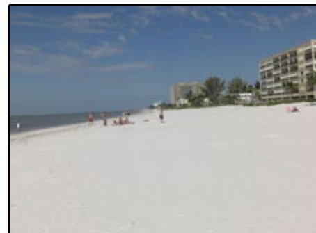
Der Strand ...

Die private Anlage ist ruhig und gepflegt. Der Freisitz vor dem Haus ist eingezäunt und kann zum grillen benutzt werden (Grill ist vorhanden). Desweiteren ist ein Gartenhäuschen hinter dem Haus. Hier finden sie 2 Fahrräder, sowie Gartenstühle und Strandliegen, die Sie benutzen können. Die Wäschespinne zum aufhängen von Wäsche gehört zur Anlage.