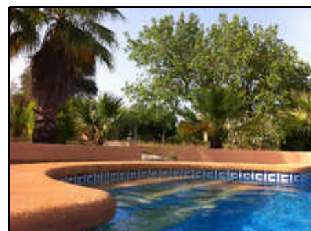
Vom Pool zum Haus