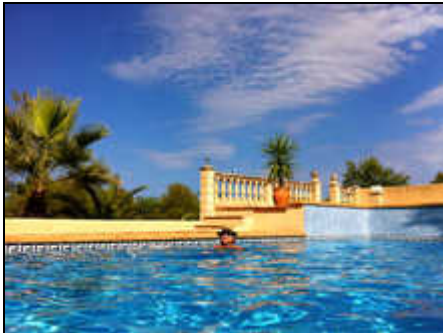
Pool 10x6x2m, Terrassen, Dusche

FINCA bei ARTA mit NATUR PUR, Idylle, großer POOL mit Quellwasser, viele Terrassen und Bäume, 6Km vom Strand Canyamel, drei GOLFPLÄTZE, Preis a.A.