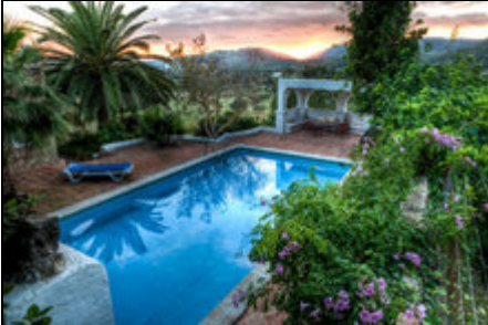
Poolbereich Finca can Lluch