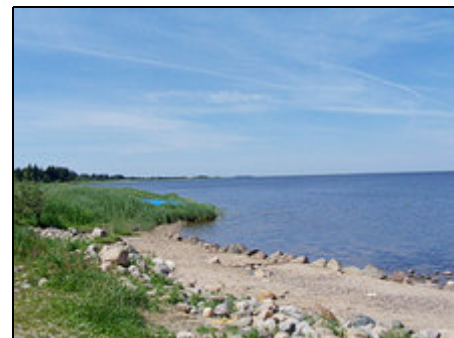
Badestrand am Fjord

Das Ferienhaus liegt ca. 500 m vom Nissum Fjord entfernt. In der ganzen Umgebung gibt es gut angelegte Wander- und Radwanderwege und das Gebiet ist günstig für Angler. Im Fjord kann man außerdem wegen des seichten Wassers und der guten Windbedingungen ausgezeichnet surfen. Wer etwas mehr Wellen mag, hat die Nordsee nicht weit entfernt. Ulfborg ist 15 km entfernt. Thorsminde, Ringkøbing und Holstebro bieten interessante Museen, Einkaufsmöglichkeiten und Sehenswürdigkeiten.