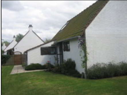
Aussenansicht von NW

freistehendes Ferienhaus auf 350m 2 Grundstück, Südterrasse, offene Küche, 2 Schlafzimmer, Galerie, Bad mit Wanne und Dusche.