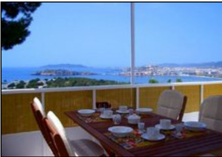
Ausblick Richtung Ibiza Stadt