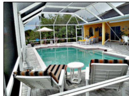
Pool mit grosser Terrasse

Lehigh Acres ist eine parkähnliche Kleinstadt mit ca. 40.000 Einwohnern und liegt ca. 25 km östlich von Ft. Myers an Floridas sonnenverwöhnter Lee Island Coast (Golf von Mexico) im ländlichen Gebiet von Lee County. Lehigh Acres ist eine ruhige Gemeinde mit Einfamilienhäusern, Eigentumswohnungen, Appartements und Golfvillen und hat neben Seen, Teichen rund 280 km Kanäle. Restaurants und mehrere Supermärkte sowie ein Wal Markt finden Sie vor Ort. Post und Banken sind ebenfalls vorhanden.