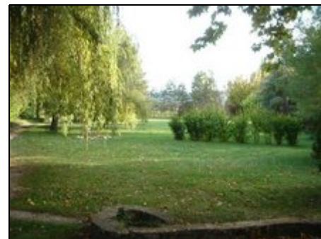
Blick in den Park

Besuchen Sie die schönen Orte und die berühmten Märkte oder ein Weingut in der Umgebung. Ist Fahrradsport Ihr Hobby, fahren Sie auf den nahegelegenen Mont Ventoux, mit einzigartiger Fernsicht, auch gut für schöne Wanderungen.