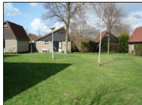
Haus 106 mit großer Spielwiese

Der Bungalow befindet sich im "Bungalowpark De Haerde" im Dorf Ellemeet zwischen Renesse und Scharendijke am Brouwersdam. Die Nordsee ist nur 700 m entfernt und bietet viele Wassersportmöglichkeiten und einen breiten Sandstrand, der zum Liegen und Wandern einlädt. Radfahrer haben viele Radwanderwege und Natur pur. Reitsportliebhaber finden in Renesse 2 Reithallen und in der Nähe gibt es 2 Schwimmbäder. Golfen kann man im nahe gelegenen Burgh-Hamstede. Kleine Städtchen laden zum Shoppen ein.