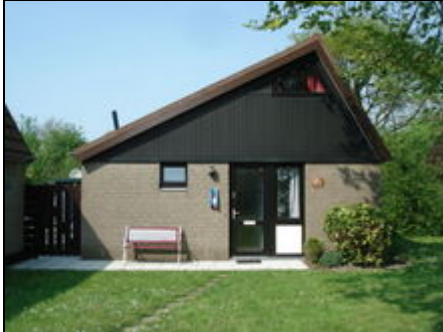
Frontansicht Haus Nr. 106

Neu renoviertes freist.Ferienhaus(nahe Renesse)eig. Garten, 800 m vom Strand und dem Grevelingenmeer, kinderfr. Neu:WLAN kostenfrei