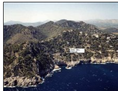
Sicht v. Meer, üb. Schrift ist d. Haus

Costa de Canyamel liegt an der Nordostküste Mallorcas zwischen Cala Ratjada und Cala Millor in einer der reizvollsten Gegenden der Insel. Herrlich ruhig gelegen, es gibt keinen Durchgangsverkehr, es ist ein reines Wohngebiet, unberührt vom Touristikrummel. Die kleine Badebucht dort ist sehr beliebt und gilt als Geheimtip. Im nahen Ortsteil Canyamel liegt der bewachte Sandstrand, umgeben von gepflegten Restaurants sowie Einkaufsläden, die auch sonntags geöffnet haben.