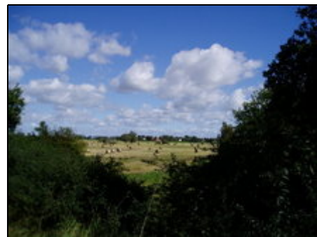
Blick über den Deich auf die Elbaue

Neu Garge liegt im Unesco-Biosphärenreservat "Flusslandschaft Elbe". Durch die frühere Abgeschiedenheit blieb die Ursprünglichkeit der Elbauen erhalten. Seltene Pflanzen und Vögel wie Seeadler, Milan und Kranich sind hier zu Hause. Hitzacker, Bleckede und Redefin bieten im Rahmen der Musikfestspiele Konzerte an. Die Festung aus dem 16. Jhd. in Dömitz und der Informationspfad zum Thema "Ehemalige Grenze" in Konau sind von Interesse. Der Deich ist ideal zum Radfahren und Inlineskaten.