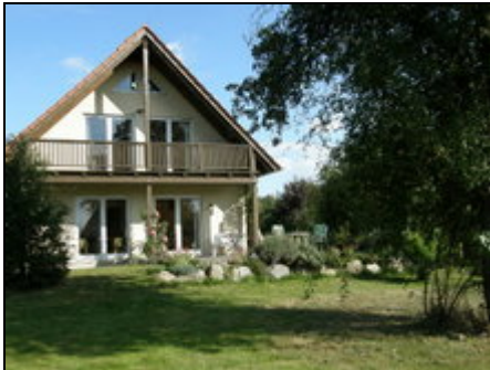
Ferienhaus Elbaue/Sicht vom Garten

Ideal für Naturliebhaber, Fahrradfahrer, Skater und besonders für Ornithologen. Das Haus liegt am Dorfrand und über eine Aue gelangt man zur Elbe.