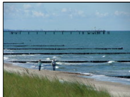
Strand mit Seebrücke

Graal-Müritz ist eines der schönsten Seeheilbäder an der Ostseeküste und erstreckt sich 5 km am feinsandigen steinfreien Ostseestrand. Die idyllische Lage als Tor zur Halbinsel Fischland/Darß/Zingst, umgeben von der "Rostocker Heide" und die Nähe zur Hansestadt Rostock machen den besonderen Reiz des Ostseeheilbades aus. Besonders Familien mit Kindern schätzen den breiten Flachwasserbereich. Am Strand sorgen im Sommer verschiedene Spielgeräte für eine willkommene Abwechslung.