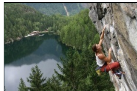
Piburger See ( 5 Gehminuten)

Winter: Skifahren in Hochötz, Sölden oder Obergurgl, Langlaufen auf 150 km Loipen. Beleuchtete Rodelbahn 5 Gehminuten, Eislaufen am Piburger See, Schneeschuhwandern.