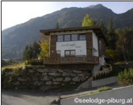
Unser neuerbautes Ferienhaus

Neuerbautes, luxuriös ausgestattetes Ferienhaus**** für Familien oder Gruppen bis 8 Personen. Unter den 10 schönsten Häusern Tirols.