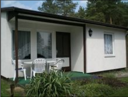
Vorderansicht mit Terrasse

Der Bungalow befindet sich in ruhiger Lage am Stadtrand von Brandenburg umgeben von einem Garten.