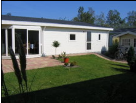
Das Haus am Meer

Super Chalet (freistehend, 75qm) für 6 Pers. (3 Schlafzimmer). Ruhig gelegen auf 400qm Grundstück (2 Seiten 'Nachbarfrei'). Nur 75 m vom Strand!