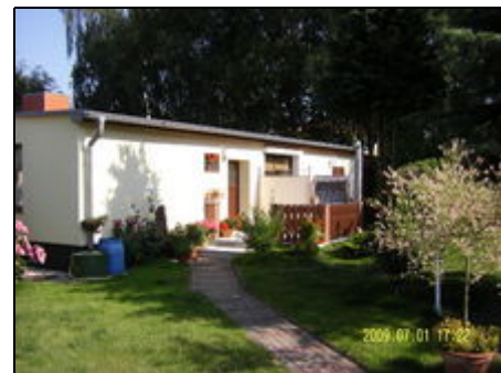
Weg zum Ferienhaus

Broderstorf liegt 7 Km östlich von Rostock. Die Entfernung zum Strand beträgt ca. 15 Km. Fahrradwege sind gut ausgebaut. Durch unmittelbare Nähe zu Ostsee und Strand sowie zur Hansestadt Rostock stellt Broderstorf der ideale Ausgangspunkt für einen erholsamen Urlaub dar. Fährverbindungen nach Dänemark und Schweden sind in Kürze zu erreichen. Fischland Darß, Rügen, Stralsund und Warnemünde sind beliebte Ausflugsziele.