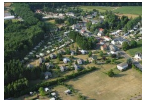
Luftaufnahme der Parkanlage

Diese Region Luxemburgs, welche auch noch den Namen Kleine Luxemburger Schweiz trägt, ist bekannt für seine herrliche Natur mit gut gepflegten Wanderwegen (100 km) inmitten eines Naturschutzgebietes, dichten Wäldern, typische Felslandschaften und malerischen Tälern mit klaren Bächen. Beaufort, mit seinen za. 2000 Einwohnern, liegt auf einer Anhöhe von 409 m. Die eindrucksvollen Ruinen der mittelalterlichen Ritterburg aus dem 12. Jht sowie die neugotische Kirche sind unbedingt einen Besuch wert